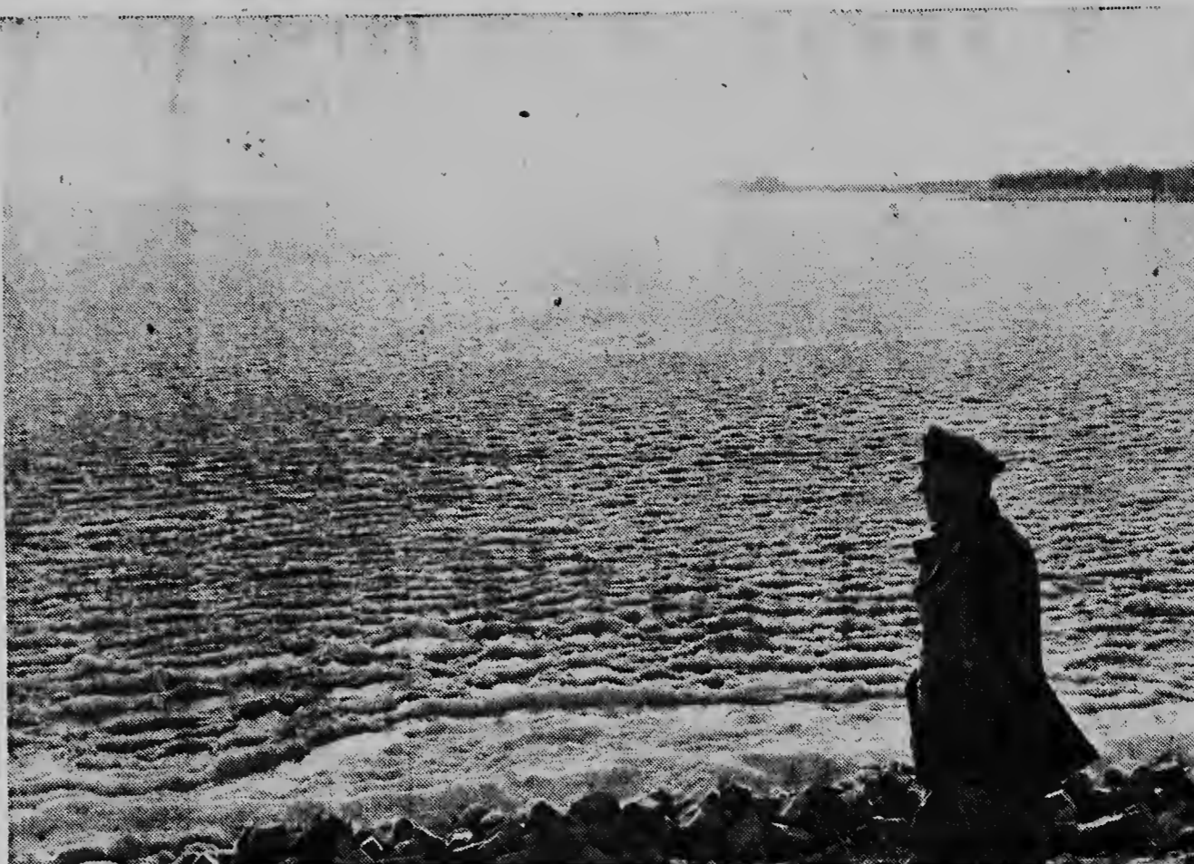
PELICULA REALISTICA PA B. B. DANES. — Riba encargo di B. B. Danes a traha un pelicula, cu lo ser presenta pa television i den cual e miradornan lo ser informa over dje peligran di un explosion nuclear.

Kende ta laga di un problema? ... Kende ta laga di un problema? ... Kende ta laga di un problema?